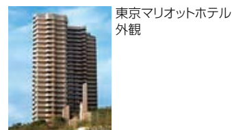
東京マリオットホテル 外観