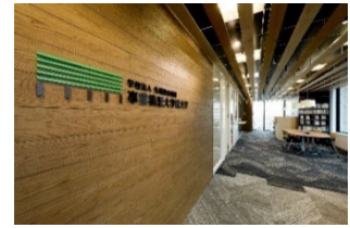
事業構想大学院大学 大阪校舎 (グランフロント大阪内)

2012年4月に東京・南青山に開学した、事業構想と構想計画を構築・実践する社会人向け大学院です。事業の根本からアイデアを発想し、事業の理想となる構想を考え、実現するためのアイデアを紡ぎ、構想計画を構築していくことを対象とした多様なカリキュラムを提供しています。多彩な業界で活躍する教員・院生と議論を重ね、2年間で事業構想計画書の提出を経て、専門職学位の「事業構想修士(専門職)」(MPD: Master of Project Design)が授与されます。拠点は東京、名古屋、大阪、福岡、仙台の5校舎で、現在12期目 計572名が修了し、数多くのイノベーションとなる新事業が生まれています。また、本学の附属研究機関である「事業構想研究所」では、企業・事業のプロジェクトベースでの研究が活発に実施され、既に2,400名以上が課程を修了しているほか、月刊『事業構想』等の出版を始め、研究書籍を発刊しています。その他、詳細は大学院HP ( https://www.mpd.ac.jp/ )をご覧ください。