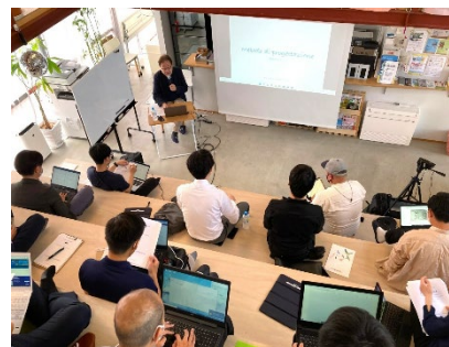
事業構想プロジェクト研究 講義の様子

地域デザインによる地域創成事業支援が専門。大手広告代理店で協働機関の起業、セールスプロモーション、PR制作、雑誌編集/執筆等に携わる。外資・国内コンサルティング企業等を経て、2016年より現職。2012年には一般社団法人地域デザイン学会の立ち上げに参画。2013年以降、父祖縁の地である兵庫県出身の大学生を支援するため、東京で学生寮の経営にも従事。官公庁、自治体の地域プロジェクトに多数参画。公益社団法人兵庫県育才理事長。