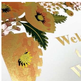
ゴールド箔+カラー印刷

「AccurioShine101」は、トナーによるデジタル箔方式を採用しており、印刷による疑似的なメタリック表現に対し、高輝度で煌びやかな付加価値の高い後加工を実現します。また高額で手間の掛かる箔押し版や型などが不要となるとともに、細かい線などのより自由度の高いデザイン度や小ロット多品種の後加工が簡単操作で実現可能となります。