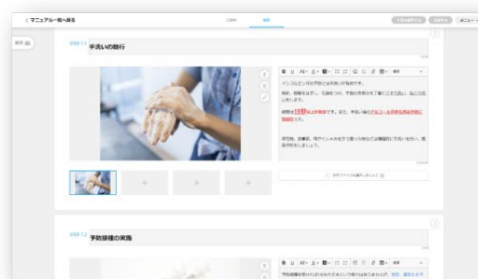
<マニュアル編集画面>

コニカミノルタジャパンは、企業の生産性や創造性を高める「いいじかん設計」を展開しています。「COCOMITE」を活用することで、作業時間削減のみならず、「創造じかん」と「自分じかん」を生み出し、顧客にとって最適な働き方を提案していきます。