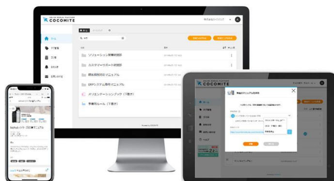
COCOMITE 端末別 トップページ

「COCOMITE」は、オンライン上でマニュアルを作成し、運用できるサービスです。画像や動画を用いた見やすく分かりやすいマニュアルが、誰でも簡単に作成できることが大きな特徴です。PCだけではなく、タブレットやモバイル端末からの閲覧も可能なため、社内外問わずどこからでもマニュアルにアクセスすることが可能です。