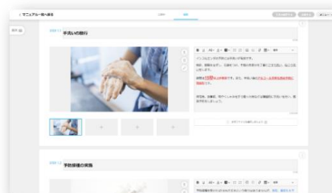
<マニュアル編集画面>

コニカミノルタジャパンは、企業の生産性や創造性を高める「いいじかん設計」を展開しています。「COCOMITE」を活用することで、作業時間削減のみならず、「創造じかん」と「自分じかん」を生み出し、顧客にとって最適な働き方を提案していきます。