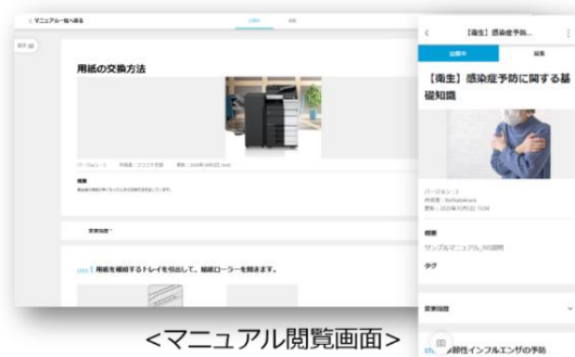
<マニュアル閲覧画面>